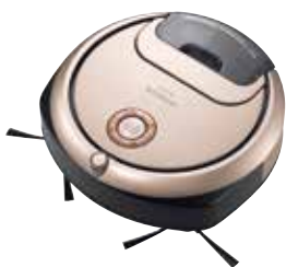
日立アプライアンスのロボットクリーナー「minimaru(ミニマル)」

キッチン・家事製品、照明・住宅設備機器、冷凍・空調機器を通じて、社会と皆様の生活に新しい価値とイノベーションをグローバルに提供しています。また、製品の省エネ性能の向上を継続的かつ徹底的に追求し、環境負荷の低減にも貢献します。