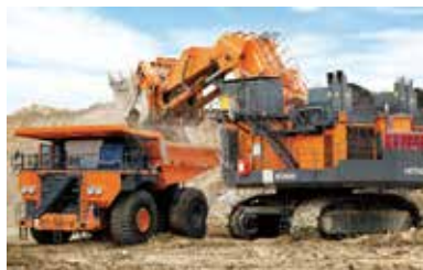
日立建機の鉱山用超大型油圧ショベルとダンプトラック

これまで培ってきた技術力とノウハウを生かし、土木・建築、ビルなどの解体、鉱山採掘など、お客様の幅広いニーズに応え、油圧ショベルをはじめとする建設機械の販売からサービス・メンテナンスまでを一貫したソリューションとしてグローバルに提供しています。