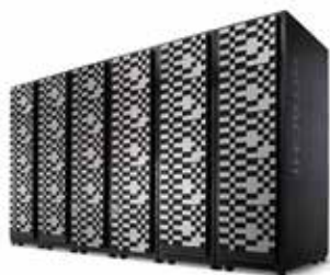
ストレージシステム

金融をはじめとした幅広い事業分野で得た豊富なノウハウと先進のITを融合することで、コンサルティングからシステム構築、運用・保守・サポートまでのシステムライフサイクル全体を通じて、お客様の多様なニーズに対応するITサービスを提供しています。