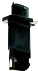
日立オートモティブシステムズのエアフローセンサー

「人・クルマ・社会」に新たな価値を創造し、豊かな社会の実現に貢献するため、環境や安全分野の領域における技術開発を加速、日立グループの情報・安全技術や社会インフラ・サービスを統合した「先進車両制御システム」を進化させ、「環境保全」「事故撲滅」「渋滞解消」などの社会ニーズ対応に取り組んでいます。