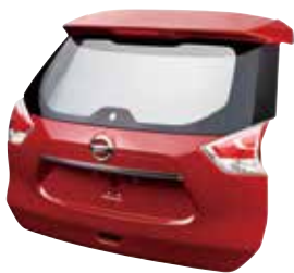
日立化成の樹脂製バックドアモジュール

これまで蓄積した技術力とノウハウを生かし、半導体・ディスプレイ材料、合成樹脂加工品、特殊鋼、磁性材料、素形材、電線・ケーブルなど、幅広い材料・部品を手掛け、自動車やIT・家電、産業・社会インフラ関連分野などにおける各種製品の高度な機能を支えています。アジア、北米、欧州などで事業を展開しています。